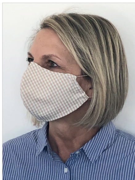
на изображении размер L